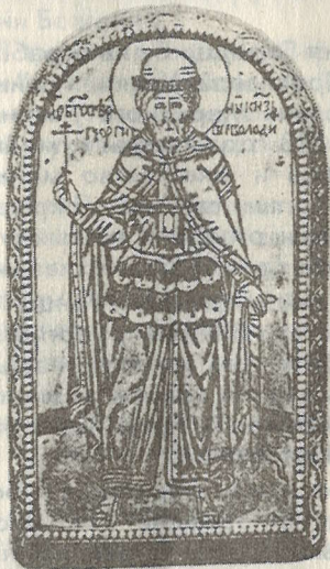
Изображение Юрия Всеволодовича на серебряной дробнице.

Через несколько дней на место побоища прибыл блаженный епископ Кирилл. Он отыскал тело великого князя Юрия Всеволодовича, "взем же перенесе е в Ростов, и пев над ним обычныя песни, и положища его во гроб в церкви святыя Богородицы со многими слезами".