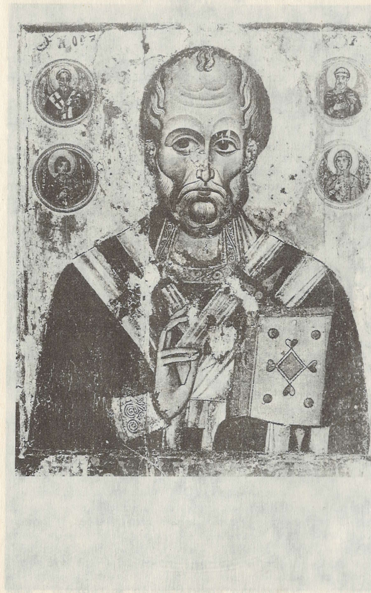
град великий князь Юрий Владимирович на берегу озера Светлояра, а во на берегах дальной Сии.

И после разорения того запустели те города Малый Китеж, что стоит на берегу Волги, и Большой, что на берегу озера Светлояра. И невидим будет Большой Китеж вплоть до пришествия Христова, как и в прежние времена такое бывало".