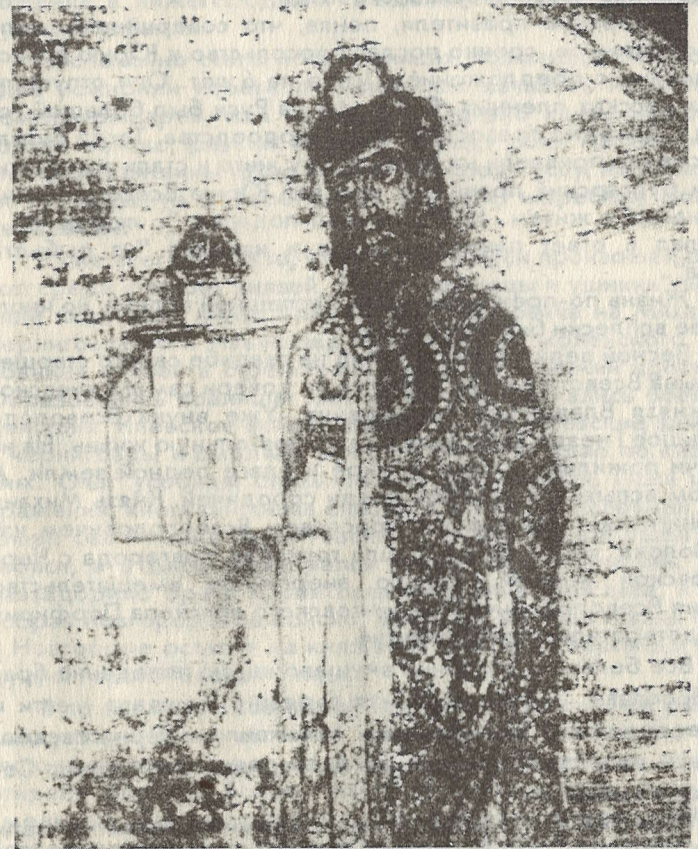
Портрет Ярослава Всеволодовича

рекся, а веру Магомета проклял. пытки не помогли и 1 апреля купец Авраамий был обезглавлен.