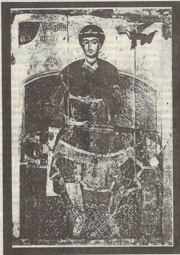
Дмитрий-Всеволод на троне. XIII в.

владимирском княжении, нес нелегкое бремя. Похоронен он был в церкви святой Богородицы "златоверхия". Любовь, вторая его супруга, вскоре постриглась и ушла в Успенский монастырь.