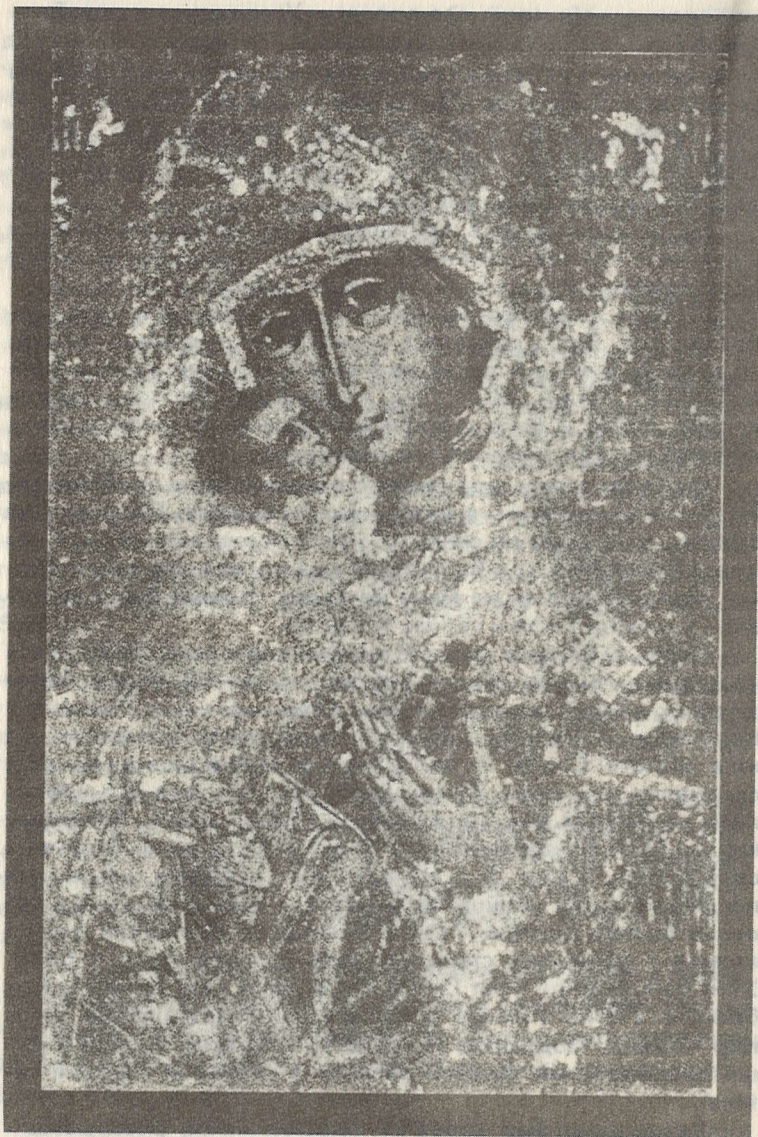
Икона Федоровской Божьей матери.

карали смертной казнью свою родню. Понемногу сходила тоска с сердца Юрия Всеволодовича. Но не было конца размышлениям о том, почему столь жестоким и кровопролитным начинался XIII век.