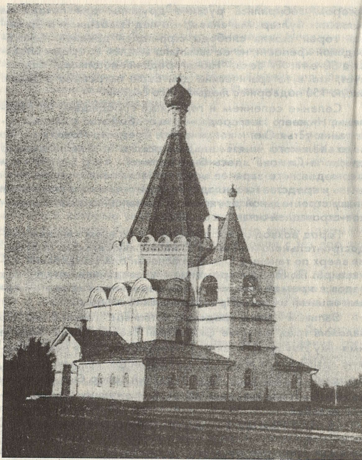
Архангельский собор в Нижнем Новгороде.

мы знаем, что в глубокой древности Волга носила индоевропейское название Ра (Великая река).