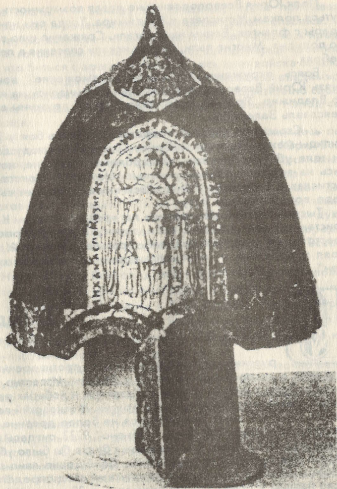
Шлем Ярослава Всеволодовича

Тяжело пришлось Мстиславу Удалому. Три атаки его полка были отбиты, несмотря на то, что князь обладал большим военным опытом. Сам он, держа в руке секиру "с паворозою", бросался в атаку и едва не сложил свою буйную голову. Его перехватил участвующий в сражении богатырь Александр Попович, тот самый, что станет былинным Алешей Поповичем. Богатырь, сразивший уже несколько новгородцев, размахнулся чтобы ударить Мстислава "великим своим мечем". Тогда герой многих битв "возопи" сквозь забрало: "Аз есмь князь Мстислав!" Богатырь Александр пощадил князя и посоветовал ему заняться княжеским делом — уряжать полки, а не метаться по полю с секирой.