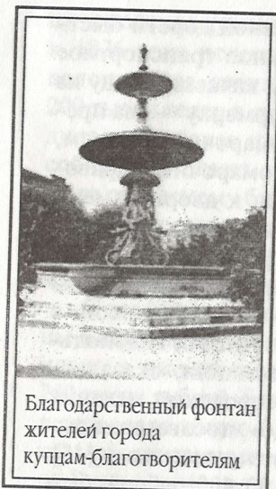
Благодарственный фонтан жителей города купцам-благотворителям

Городская дума, преисполненная признательности купцам-благотворителям, в том же 1879 году удовлетворила ходатайство старообрядцев о расширении раскольничьего кладбища, к сожалению, уничтоженного и застроенного жилыми домами в советские годы. В 1880 году дума собиралась «почтить господ жертвователей, по русскому обычаю, “хлебом-солью”, предложив им благодарственный обед от имени города» [48]. Но они, старообрядцы, повели себя, как обычно, скромно — с заботой не о себе, а о жителях. Отказавшись от торжественного чествования, попросили думу использовать деньги, собранные на обед, «на цели более полезные».