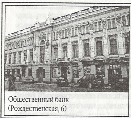
Общественный банк (Рождественская, 6)