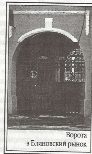
Ворота в Блиновский рынок