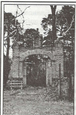
Ворота Малиновского скита