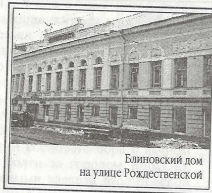
Блиновский дом на улице Рождественской

Но братья Блиновы не пали духом. В 1870 году они, минуя