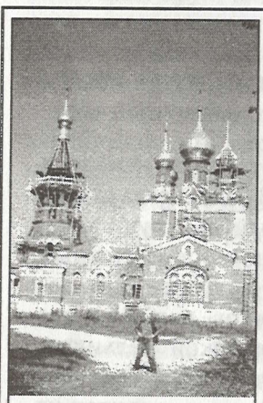
Старообрядческий храм Малиновского скита