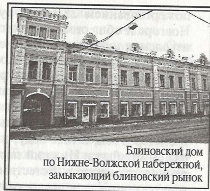
Блиновский дом по Нижне-Волжской набережной, замыкающий блиновский рынок