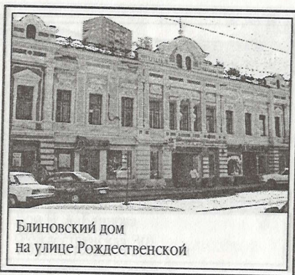
Блиновский дом на улице Рождественской