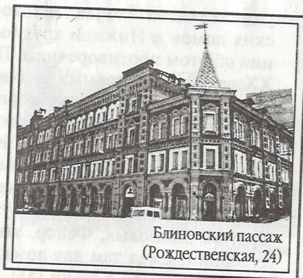
Блиновский пассаж (Рождественская, 24)