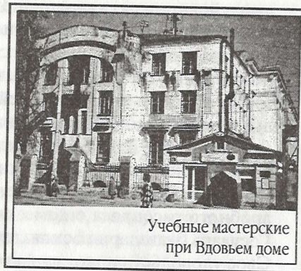
Учебные мастерские при Вдовьем доме

Призреваемые в доме семейства все находились в сборе. Трогательная картина представилась глазам, когда со слезами счастья и благоговения призреваемые здесь вдовы и сироты, взрос-